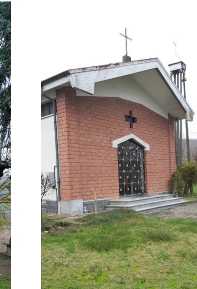
Cappella di Nostra Sig.ra della Pace Reg. Salere