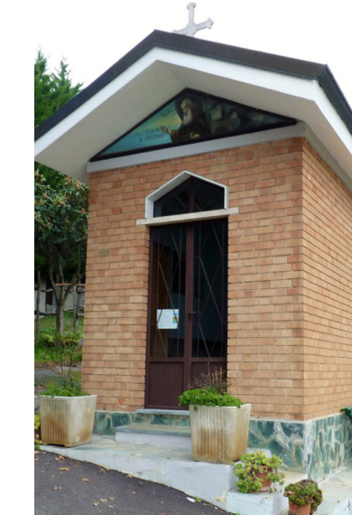
Cappella di S. Antonio Reg. Dogliano