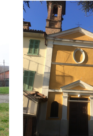
Chiesa dell'Immacolata Reg. Vianoce