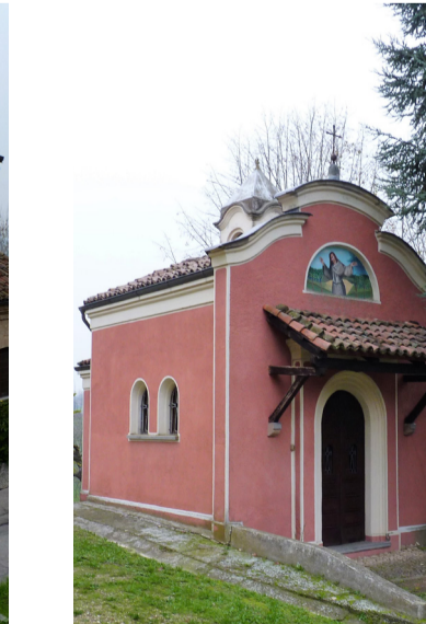
Chiesa di S. Maria Maddalena Reg. Bologna