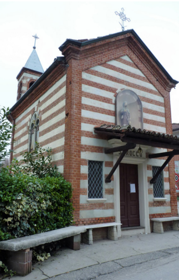
Cappella di San Rocco Reg. San Rocco