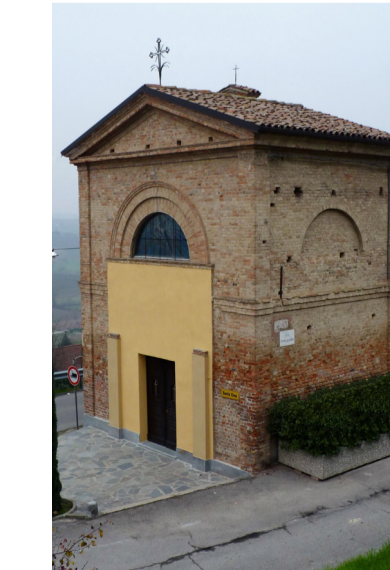
Cappella della Santa Croce Loc. Santa Croce