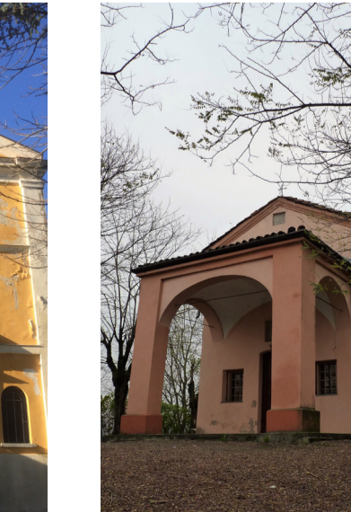
Cappella di S. Sebastiano Loc. San Sebastiano